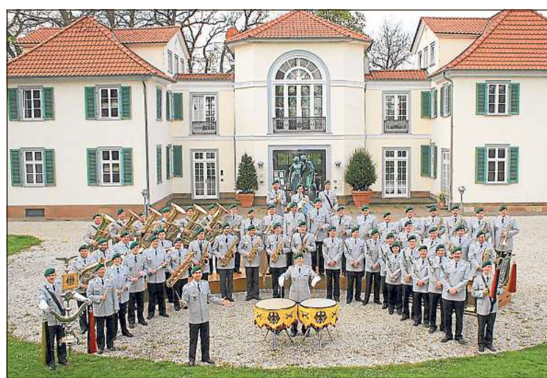
Musikkultur in ihrer schönsten Form möchte das Heeresmusikkorps beim gastspiel in Lippstadt präsentieren.