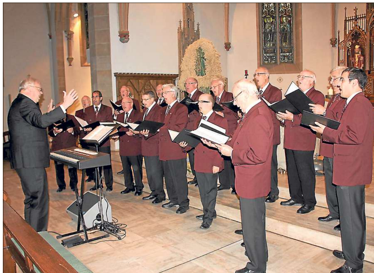
Den Stress und die Hektik des Alltags hinter sich gelassen hat der Männergesangverein 1857 Langenberg beim so genannten Evensong in der Langenberger Pfarrkirche St. Lambertus am Sonntag. Chorwerke, Gemeindegesänge, Lesungen, Gebete und Orgelmusik bildeten dabei eine liturgische Einheit, die ihre Zuhörer begeistert.